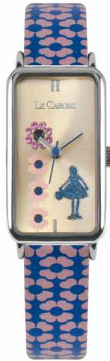
Otto e mezzo